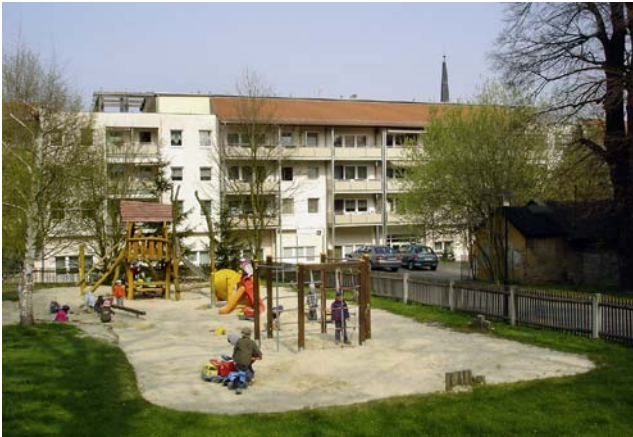
Abb. 3: Gemeinde Droyßig (Burgenlandkreis), gelungene Verbindung von Jung und Alt sowie Revitalisierung von Wohnungsleerstand: Kindergarten und Seniorenresidenz im umgenutzten Plattenbau

chen der kommunalen Entwicklung aufzuzeigen. Diese Konzepte sollen einerseits als Orientierungshilfe und Strategiekonzept zur Einordnung öffentlicher und privater Planungen und Projekte in den gesamtgemeindlichen Zielrahmen dienen, andererseits müssen die aufgezeigten Handlungsfelder mit entsprechenden Maßnahmebündeln tatsächlich umgesetzt werden (Maßnahmenplan als Kontroll- und Steuerungsinstrument). Sowohl in der Phase der Erarbeitung als auch der Umsetzung sollten die Akteure übergeordnete Prinzipien beachten: Prinzip der bedarfsgerechten Anpassung, Prinzip des ressortübergreifenden integrierten Ansatzes, Prinzip der interkommunalen Zusammenarbeit, Prinzip der Partizipation und Prinzip der Nachhaltigkeit.