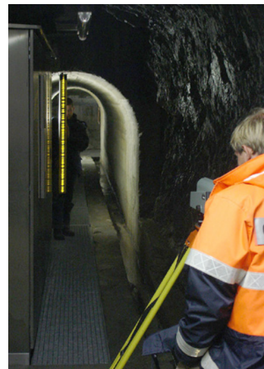
Abb. 5: Einsatz in der Talsperre