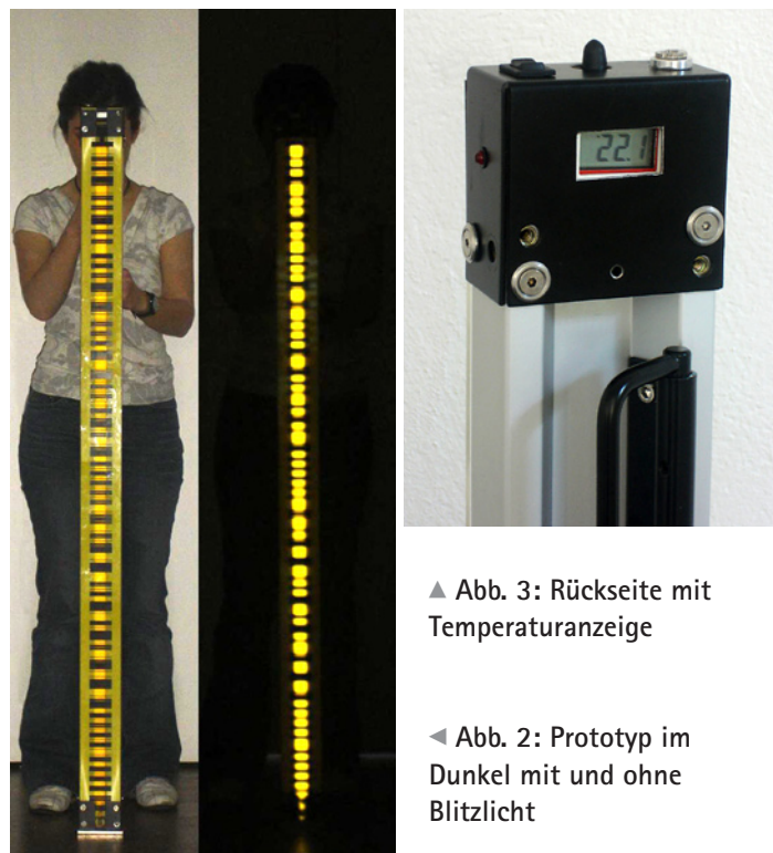
▲ Abb. 3: Rückseite mit Temperaturanzeige