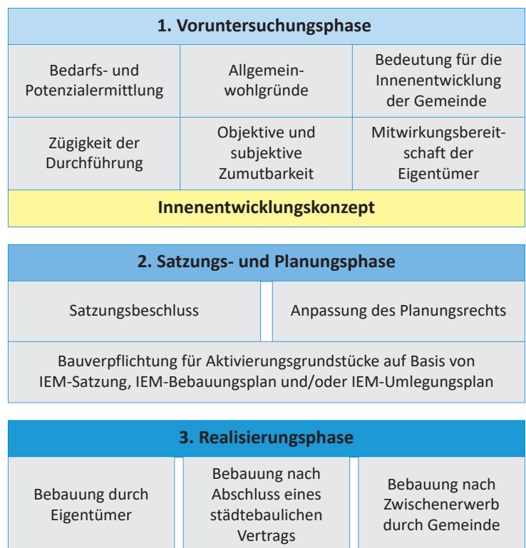
Abb. 5: Ablauf der Innenentwicklungsmaßnahme

Auf Basis des Ergebnisses der vorbereitenden Unter- suchung soll das IEM-Gebiet durch die Gemeinde mittels Satzung förmlich festgelegt werden. In der Satzung sind das Gebiet, die Aktivierungsgrundstücke sowie die jewei- ligen Bebauungs- und Nutzungsziele einzeln zu benennen, die mittels Bauverpflichtung umgesetzt werden sollen. Die Bauverpflichtung muss hinreichend konkret begründet werden und kann bei ausreichendem Planungsrecht nach