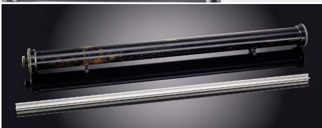
Unten: Eine der nationalen Kopien des Urmeters. Diese Kopie (mit der Nr. 23) ist Deutschland zugelost worden und befindet sich in der PTB.