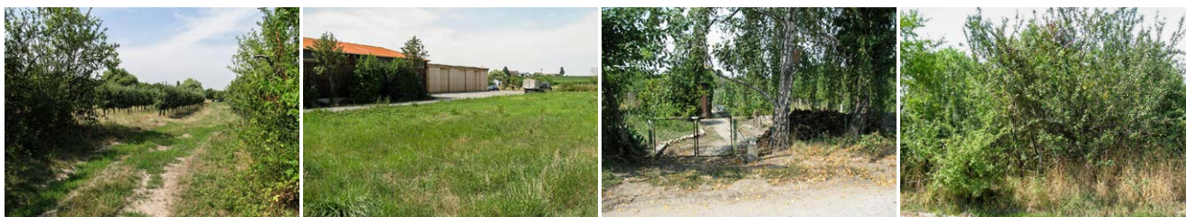
Abb. 3-6: Nutzungssituation in der vereinfachten Flurbereinigung Erpolzheim

eigentümer durch Bodenspekulationen (erhoffte Aufwertung des Bodenwertes wegen Überlegungen der Planung eines Gewerbegebiets) nicht mehr vorhanden. Da sich zudem der Einwirkungsbereich des zur Umsetzung des wasserwirtschaftlichen Planfeststellungsbeschlusses benötigten Gebietes nicht mehr mit dem Gebiet des vereinfachten Flurbereinigungsverfahrens deckte und die Enteignungsbehörde einen Antrag auf Durchführung einer Unternehmensflurbereinigung nach §§ 87 ff. FlurbG gestellt hatte, wurden 2015 alle Flächen, die für die Durchführung der Unternehmensflurbereinigung benötigt wurden, aus dem vereinfachten Flurbereinigungsverfahren ausgeschlossen. In einem wesentlich erweiterten Gebiet wurde dann die Unternehmensflurbereinigung angeordnet.