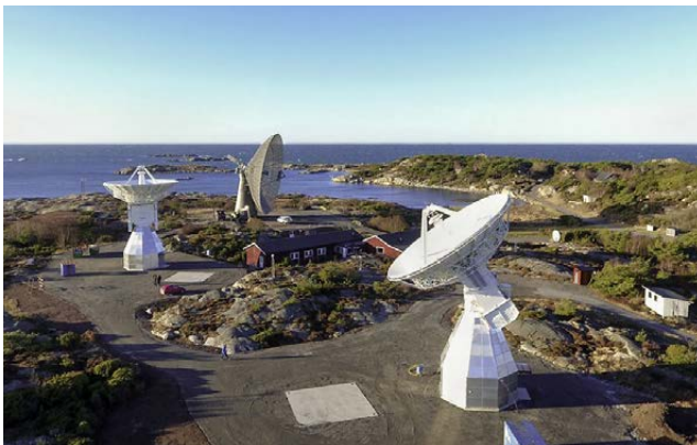
Abb. 1: Die beiden im Bau befindlichen Onsala-Twin-Teleskope sowie das 25 m Radioteleskop im südlichen Teil am OSO

Das lokale Vermessungsnetz des OSO befindet sich in einem zum Großteil naturbelassen Reservat. Gneisgestein formt in diesem Areal ein sehr bewegtes Geländeprofil,