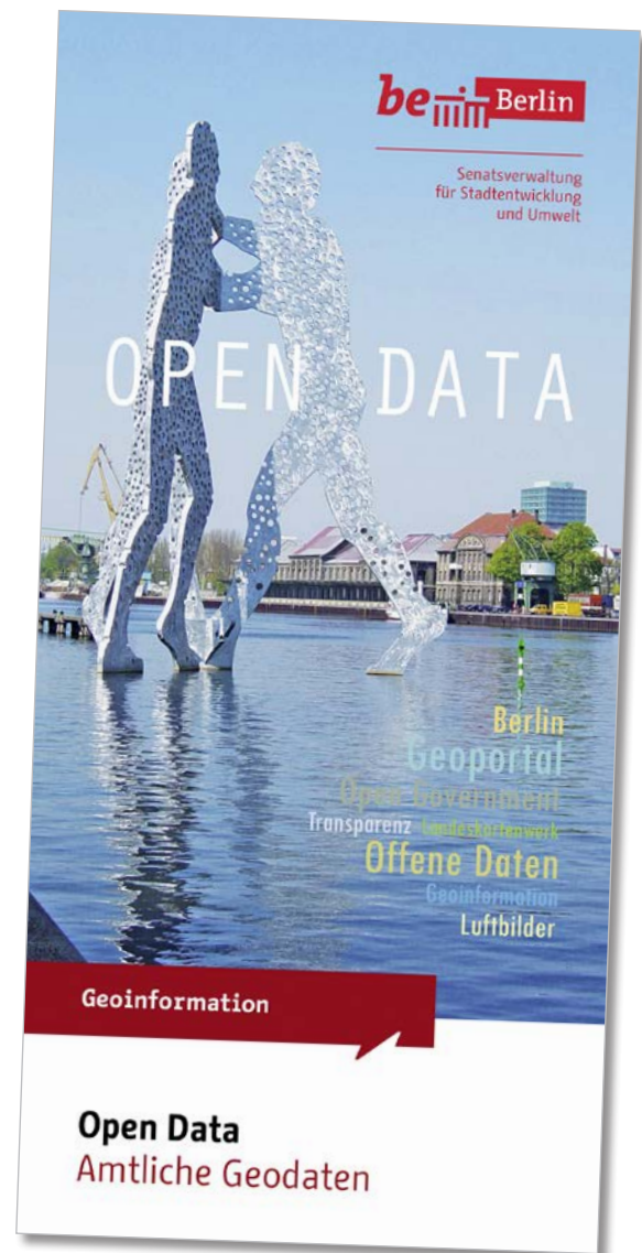
Abb. 1: Flyer der Abteilung Geoinformation, Titelseite

Durch Entscheidung im Februar 2012 folgte die politische Leitung der Empfehlung der Abteilung Geoinformation, Open Data für den Fachbereich Geoinformation umfassend umzusetzen (Näheres unter 4.3). Die Option zur le-