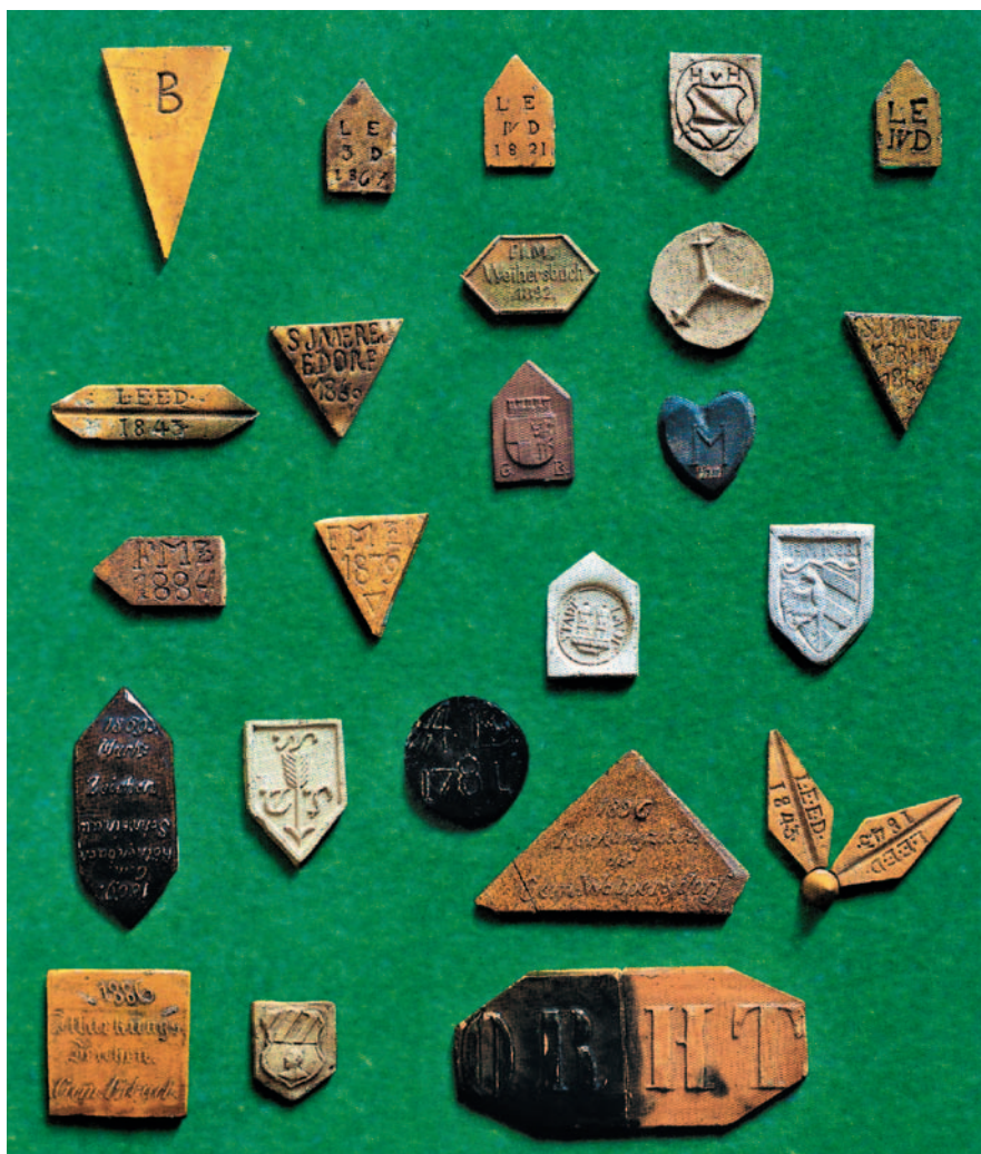
Abb. 3: Eine Auswahl schöner Siebener- zeichen aus der Sammlung des Bayerischen Nationalmuseums (Wesel 2001)

Die Grenzsicherung durch Grenzsteine erfolgt regional unterschiedlich und hat im Laufe der Jahrhunderte Veränderungen erfahren. Mittels Grenzsteinen werden nicht nur Grundstücks-, sondern auch Jagd- und Fischereigrenzen gekennzeichnet. Historische Grenzsteine – der älteste mir bekannte trägt die Jahreszahl 1693 und steht in der Gemeinde Baudenbach – sind meist in Wäldern zu finden, da hier seltener Neuordnungen vorgenommen wurden. Die Steine sind mit verschiedenen Zeichen, teilweise auch mit Geheimzeichen, versehen. Flurgrenzsteine tragen häufig Wappen des Adels oder die Initialen der angrenzenden Orte. An der Oberseite wurden Kerben eingeschlagen, die auf den Standort des nächsten Grenzsteins, also den Verlauf der Grenze hinweisen (Abb. 2). Zur Sicherung des Standortes wurde von den Feldgeschworenen früher Tierblut, Asche oder auch Humuserde unter die Steine eingebracht. Zusätzlich wurden unter den Stein geheime Zeichen aus unvergänglichen Materialien wie z. B. Ton, Porzellan und Glas gelegt (Abb. 3). Sie folgen spezifischen Regeln, die unter das Siebenergeheimnis fallen, auf das der Feldgeschworene einen Eid ablegt und bis ans Lebensende wahren muss. Die Geheimzeichen spielen