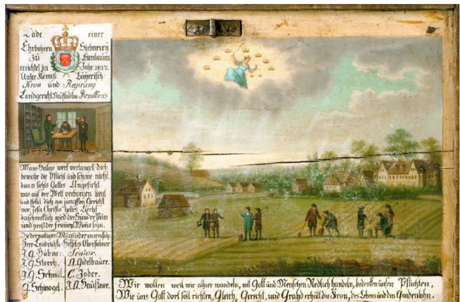
Abb. 4: Ölgemälde in der Siebenertruhe des Kollegiums Birnbaum von 1817

Zeugnis für die historischen Aufgaben und Arbeitsweisen der Siebener liefern die sogenannten »Siebenertruhen«, in denen nicht nur schriftliche Unterlagen geborgen sind, die Jahrhunderte gewissenhafter Arbeit dokumentieren, sondern auch die Gestaltung der Truhen selbst liefert wertvolle Informationen (Abb. 4). So kann die Truhe meines Kollegiums Birnbaum nur mit zwei unterschiedlichen Schlüsseln geöffnet werden, die bei verschiedenen Kollegen aufbewahrt werden. Dies entspricht dem seit jeher in der Siebenerei gültigen Vieraugenprinzip. Die Truhe ist fast 200 Jahre alt und der Deckel trägt