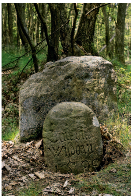
Abb. 2: Grenzsteine (Püschel 2001)

Von grundlegender Bedeutung ist die von Karl dem Großen um das Jahr 800 angeordnete Realteilung. Realteilung heißt, der Grundbesitz einer Familie wird zu gleichen Teilen an die männlichen Nachkommen vererbt. So entstanden mit der Zeit Flurstücke, die oft nur wenige Meter breit, aber meist sehr lang waren, wie auf dem Flurplan aus Marktheidenfeld zu ersehen ist (Abb. 1). Die Realteilung traf Franken härter als andere Gebiete, da die Besitzverhältnisse aufgrund der Adelsstruktur schon vorher besonders kleinteilig waren (Wesel 2001). Das Land lag in den Händen unzähliger niedriger Adelige, die jeweils nur über sehr begrenzte Besitzungen verfügten, die sie unter ihren Bauern aufteilten. Dazu kam, dass – wie in der erwähnten Gemeinde Gerhardshofen – die einzelnen Bauern unterschiedlichen Grundherren lehenspflichtig waren. Selbst einzelne Siebener gehörten flächenanteilig zu verschiedenen Grundherren. Diese Struktur hatte auch zur Folge, dass eine sehr große Zahl an Grenzen zwischen den einzelnen Adelsbesitztümern zu betreuen war. Seine Feld-, Fischerei- und Jagdgrenzen sicherte der Adel mit Hilfe der Feldgeschworenen.