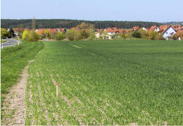
Abb. 7: Die roten Pflocken markieren die Grundstücksgrenze. Es fehlen die Grenzsteine und Gemeindeland wird widerrechtlich genutzt.

In vielen Gemeinden führen die Feldgeschworenen alljährlich Flurumgänge durch. Diese werden im Gemeindeblatt bekannt gegeben. Die Landwirte werden aufgefordert, ihre Grenzsteine in dem zu begehenden Teil der Flur aufzudecken, damit die Grenze von den Siebenern eingesehen werden und festgestellt werden kann, ob alle