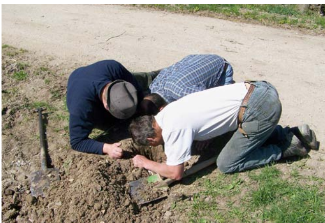
Abb. 6: Siebener bringen vor der Steinsetzung ihre Geheimzeichen ein.

Durch das »Gesetz, die Abmarkung der Grundstücke betreffend« vom 30. Juni 1900, das die öffentlich-rechtliche Abmarkungspflicht einführte, wurde jedoch das Monopol der Feldgeschworenen zu Gunsten der Geometer gebrochen. Die Vermessung stand jetzt über den Geheimnissen der Siebener (Püschel 2001). Nach dem derzeit gültigen Abmarkungsgesetz dürfen die Feldgeschworenen mit Einverständnis der beteiligten Grundstückseigentü-