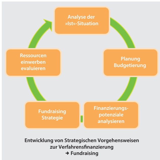
Abb. 5: Fundraising-Kreislauf (vereinfachte Darstellung nach Bürgergesellschaft 2013)

Die Höhe der Kosten in einem Flurneuordnungsverfahren wird wesentlich von den durchzuführenden investiven Maßnahmen bestimmt. Dabei spielt es eine wesentliche Rolle, wer die Geldmittel aufbringen muss. In der Regel sind dies die Grundstückseigentümer unter Berücksichtigung der jeweiligen Zuschüsse. Oft unterstützen Kom-