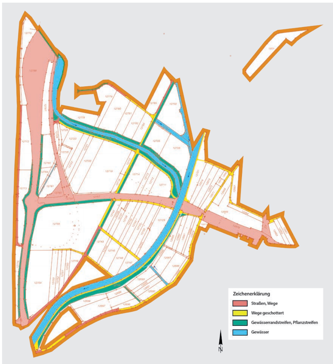
Abb. 4: Neuer Stand der Flur- neuordnung Singen »Nordstadt- anbindung«

Die grundsätzliche Vorgehensweise wurde in mehreren Verfahren, jedoch mit anderen Verfahrenszwecken bereits erfolgreich durchgeführt, wie in Kap. 5.1 und 5.2 dargestellt. In diesen Beispielen hat sich gezeigt, dass zwei wesentliche Komponenten zum Erfolg beigetragen haben: