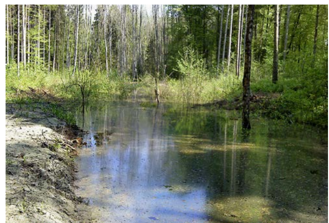
Abb. 3: Feuchtbiotop im Waldverfahren