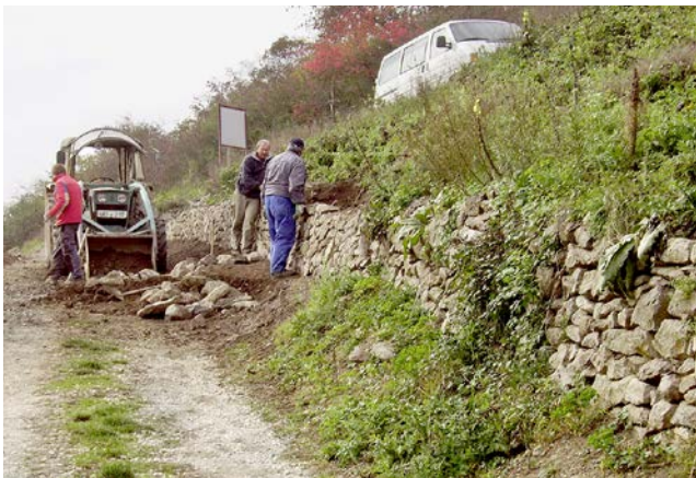
Abb. 1: Trockensteinmauern am Hohentwiel

selbst verfügen über eine besondere Fauna und Flora. Der Erhalt des Weinbaus in diesem Gebiet liegt im Interesse des Naturschutzes. Dazu war aus Sicht des wichtigsten Bewirtschafters eine Umgestaltung notwendig. Um festzustellen, ob eine Neuordnung des Gebietes auch für den Betrieb vertretbar ist, hat der Bewirtschafter nach Vorliegen einer Grobplanung zunächst eine Wirtschaftlichkeitsberechnung durchgeführt.